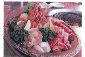
(写真はイメージです)

黒毛和牛ローズ 200g あぐ〜豚上ローズ 100g 骨付きカルビ 100g チキンコマ 80g 牛マルチョウ 100g ウィンナー 2本 野菜・コーン